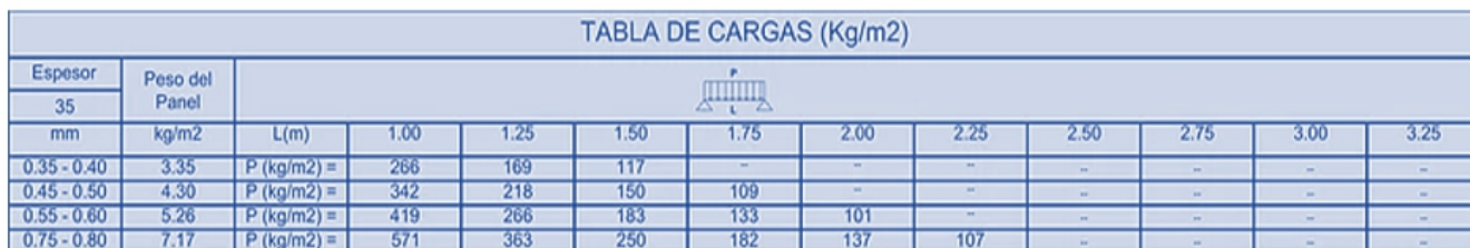
TABLA DE CAPACIDADES DE CARGA (KG/M2)